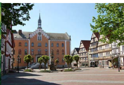
Rathaus von Hofgeismar