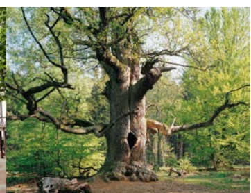
Kameneiche im Reinhardswald